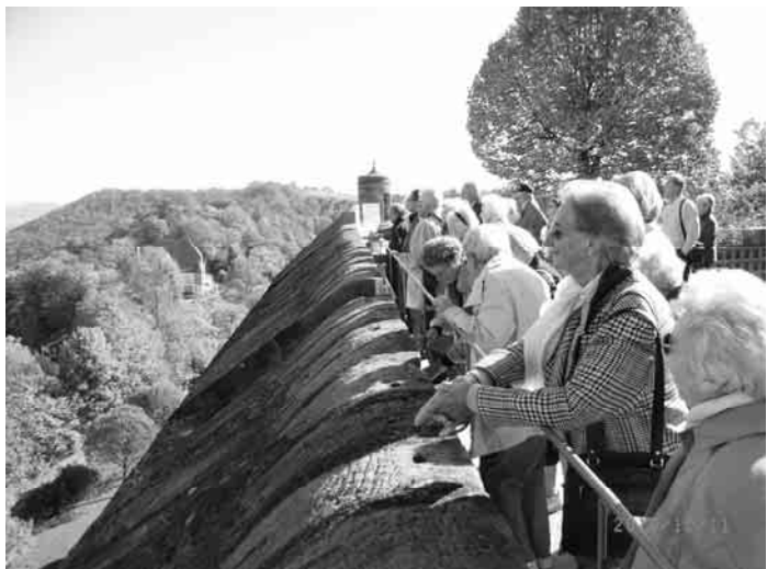
Blick ins Land von der Veste Coburg

Und dann sangen wir zum Abschluss alle gemeinsam noch unser tägliches Essenslied: "Danket, danket dem Herrn...". Gretel Bosch