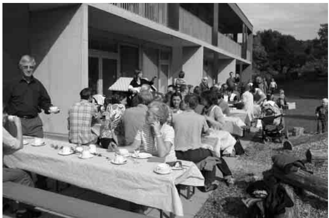
Das Wetter machte mit: Feier des einjährigen Jubiläums des Gartenstadt- hauses.

Zum Sektempfang spielte der Posau- nenchor auf, bevor man sich bei einem reichhaltigen Suppenbuffet und später bei Kaffee und Kuchen stärken konnte. Die Kinder nahmen mit Begeisterung den neu gestalteten Garten in Besitz, das Kasperle und eine Spielstraße lu- den ein. Bei Führungen durchs Haus konnte man sich über die Konzeption des Familienzentrums informieren. Und auch die neu eingerichtete Bü- cherecke wurde eingeweiht. Ein gelun- genes Fest, bei dem das Kinder-, Fami- lien- und Gemeindezentrum feierte.