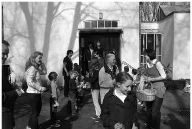
Eine hoffentlich wachsende und gedeihende Erinnerung an diesen Familiengottesdienst: Samen von Sonnenblumen.