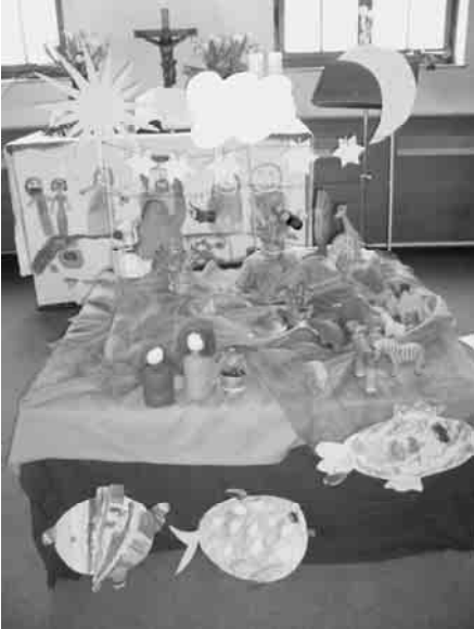
Die Erschaffung der Welt – gezeigt von Kindergartenkindern aus Sirnau.

Am 3. April, einem strahlenden Sonntagmorgen, trafen wir uns mit den Kindern des Kindergartens um unseren Familiengottesdienst zum Thema „Schöpfung“ zu feiern.