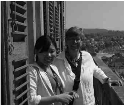
Ein weiter Blick über Esslingen hinaus.

10. Was war Dein schönstes Erlebnis hier? Der Aufstieg auf die Türme der Stadtkirche in Esslingen und der weite Blick und der große Himmel.