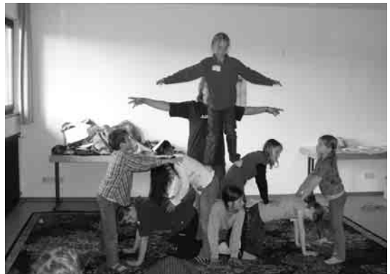
... wie auch das Training für die Zirkusaufführung.