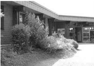
Das Ertinger-Haus, erbaut 1979.