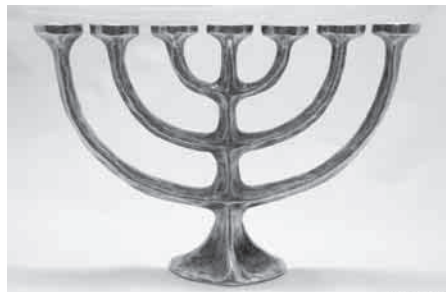
Menora – Siebenarmiger Leuchter.

Verlust auch nach 7 Tagen ein erstes „genug“ erreichte. Und ihnen fällt eine Parallele, eine Nachbarschaft, im Arbeitsleben auf. Auch die Arbeit hatte am 7. Tag ein Aufhören verdient. Wenn die Alten Israels das Ende der Hochzeit und das der Trauer ausdrückten, nahmen sie dasselbe Wort, nämlich sabbat, aufhören, das sie auch für die Ruhe des 7. Tages verwendeten. Als wäre der Rhythmus der Sanduhr den Menschen ins Herz gedrückt, als klopfe das Herz im Puls von 7 Tagen, als mahne die Natur in Freud und Leid und der Mühsal der Arbeit im Turnus der 7 Tage: Hört auf, gebt Ruhe, unterbrecht.