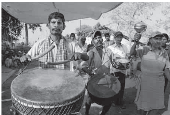
Um auf lokale Politiker Druck auszuüben, organisiert BIRSA auch Demonstrationen.

Die von „Brot für die Welt“ unterstützte Organisation BIRSA setzt sich seit mehr als 20 Jahren für die Rechte der Ureinwohner von Jharkhand ein. Die Mitarbeitenden halten Kontakt zu den Dörfern, tragen Informationen zusammen