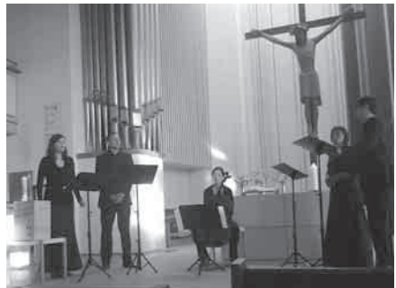
Capella nova im Mai 2011 in der Martinskirche

Wir bitten jedoch herzlich um Spenden zur Deckung der Kosten für dieses besondere Konzert.