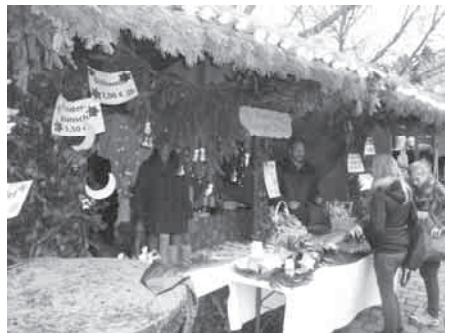
Stand des Sirnauer Kindergartens auf dem Esslinger Weihnachtsmarkt 2011

Anfang Dezember hatten wir dann zu uns in den Kindergarten eingeladen. Mit Liedern, Fingerspielen und einer Klanggeschichte wollten wir unsere Eltern verwöhnen. Bei einem Glas Sekt durften die Eltern unser Dankeschön genießen.