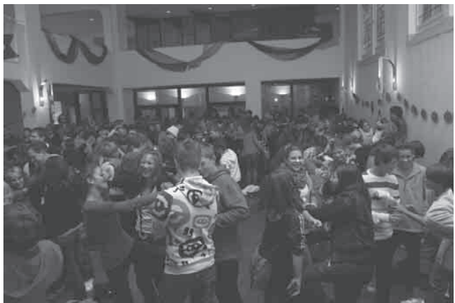
Jugendliche beim ersten AHOJ-Gottesdienst in der Johanneskirche im Oktober 2011

Jugendliche ab sechzehn wünschen sich derzeit eher Jugos in kleineren, überschaubaren Gruppen – das gemeinschaftliche Miteinander ist wichtiger als eine große Zahl an Besuchern. Zwanzig oder dreißig Personen sind gut und ausreichend. Idealerweise