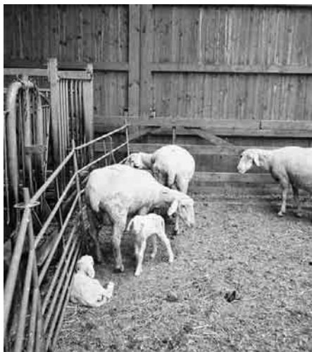
Nachwuchs im Schafstall

Die letzte Rast erfolgte in Gruorn. Das Dorf wurde 1937 völlig geräumt zur Erweiterung des Truppenübungsplatzes. Der Erhalt der Stephanskirche wurde durch ein Komitee ehemaliger Dorfbewohner möglich. In dieser Kirche erhielten wir einen umfassenden Geschichtsunterricht von unserem versierten Begleiter.