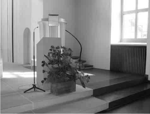
Der Blumenschmuck in der Kirche ist nur ein Bruchteil der Mesneraufgaben.

ruft. Gibt es auch so etwas wie Supervision für Mesner?