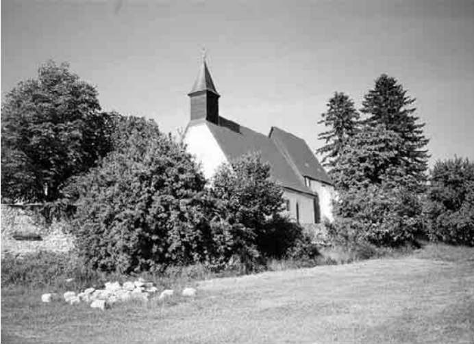
Kirche in Gruorn