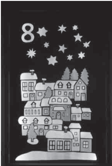
Hettlinger Adventsfenster von 2009

So funktioniert der Lebendige Adventskalender: In den Adventswochen trifft man sich zweimal in der Woche um 17.30 Uhr vor dem Gartenstadthaus und singt gemeinsam ein Lied. Dann geht es mit Laternen zu einem Oberesslinger Fenster – vielleicht zu Ihrem? Vor dem Haus der Gastgeber angekommen singen wir nochmal ein Lied. Dann wird ein adventlich geschmücktes Fenster beleuchtet oder enthüllt.