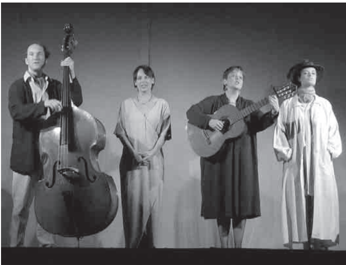
„Dein Theater“ aus Stuttgart