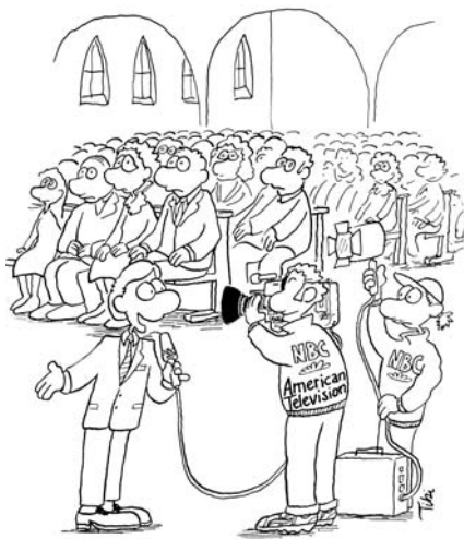
»And here wir berichten aus eine deutsche Gottesdienst von ein Phänomen, das ist viel rätselhafter als die Toronto-Segen: totale Erstarrung!«

wäre es nicht schön und an der Zeit, wir würden in Oberesslingen unsere Gottesdienstgestaltung etwas aufmischen?